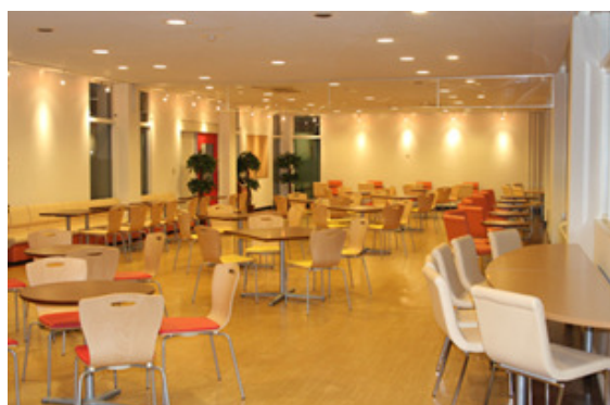
昨年リニューアルした1号館学生談話室