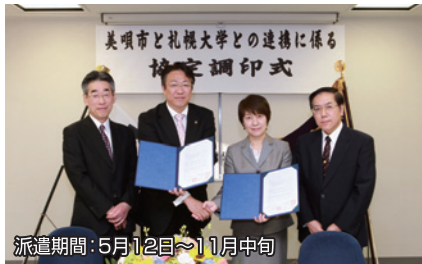
派遣期間：5月12日～11月中旬

札幌大学では、北海道美唄市が推進する事業への協力、インターシッピやフィールドワーク、学術調査、同市の札幌大学への実践的教育の場の提供など、教育・研究・人材育成における相互協力を推進するため協定を締結する運びとなり、4月24日に調印式を行いました。