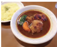
1番人気のチキンカレーは皮バリチキンがゴロゴロ！