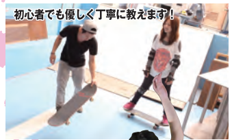
初心者でも優しく丁寧に教えます!