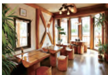
ジャズのBGMがよく合うオシャレな店内