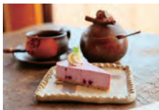
手作りのブルーベリーレアチーズケーキ