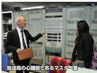
放送局の心臓部であるマスター室

番組とスポンサーの間に入る営業部、番組全体のプログラムを組み立てる編成部、番組の中身を作る制作部、ライブなどを主催する事業部、その他、技術部や総務部があります。