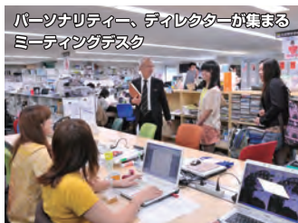
パーソナリティ、ディレクターが集まるミーティングデスク

僕は学生時代から音楽とファッションとイベントが大好きで、それらに関わる仕事がしたいと思っていました。