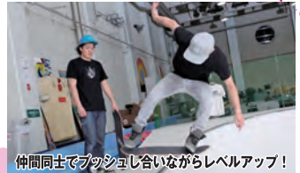
仲間同士でフッシュし合いながらレベルアップ!