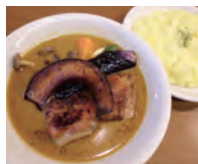
ココナツカレーは辛いのが苦手な人にオススメ！