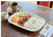
選べるプレートランチセット(焼肉プレート)